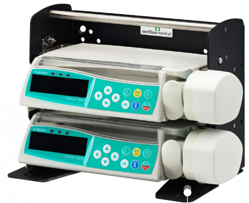
Beispiel-Projekt: Halterung für Space-Geräte der Firma B. Braun ®